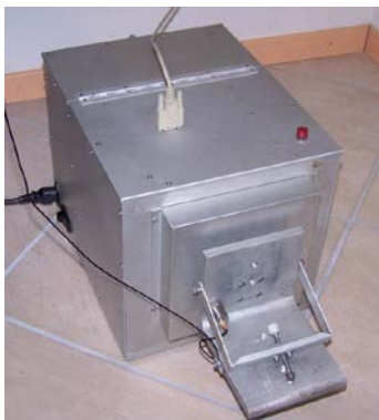
Tavola vibrante Larcor ST1

"Criteri di misura e valutazione degli effetti delle vibrazioni sugli edifici" La norma fornisce una guida per la scelta di appropriati metodi di misura, di trattamento dei dati e di valutazione dei fenomeni vibratorii per permettere la valutazione degli effetti delle vibrazioni sugli edifici, con riferimento alla loro risposta strutturale ed integrità architettonica.